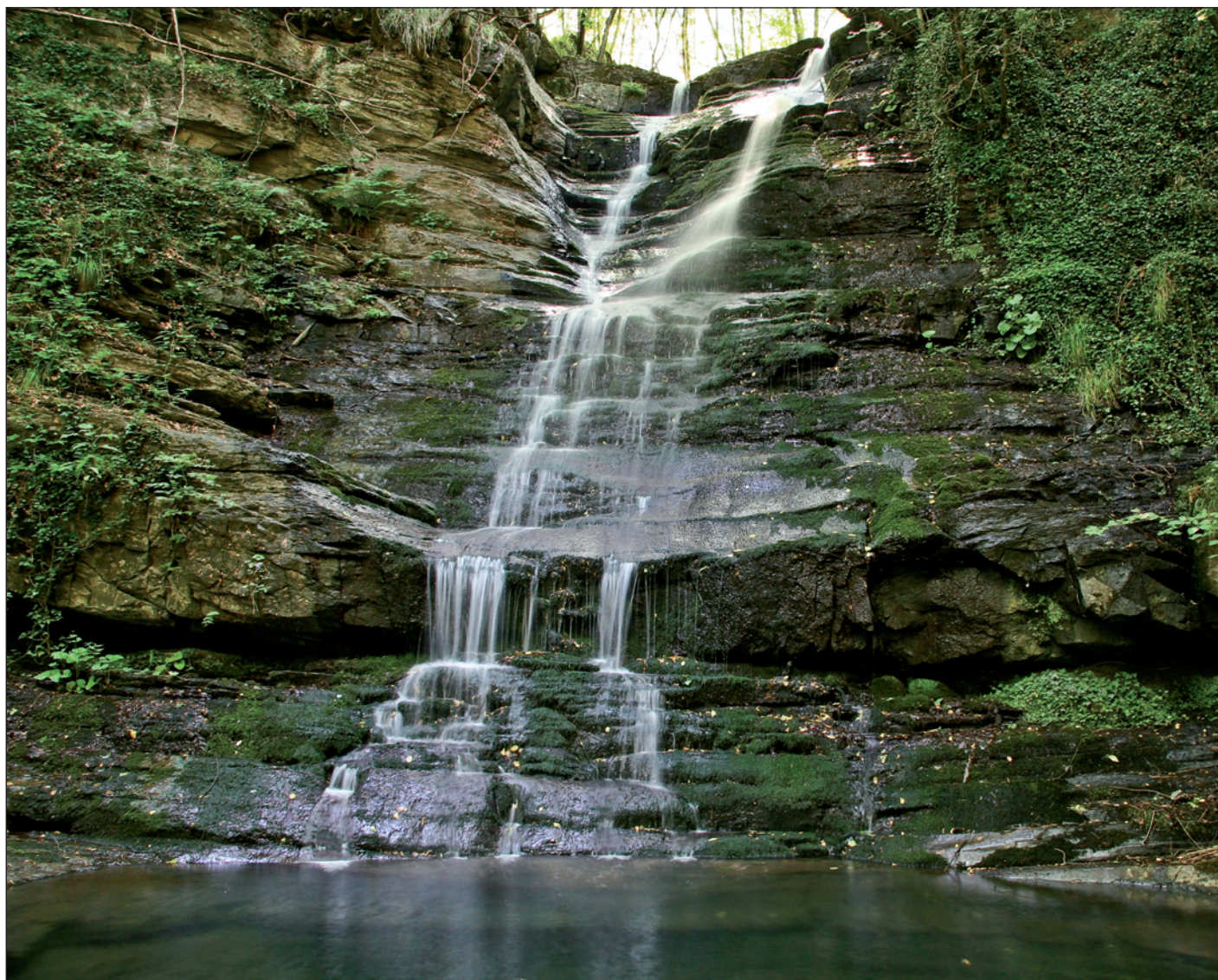
Cascata in Comune di Granaglione (BO)- Formazione di Stagno: torbiditi arenaceo pelitiche organizzate in pacchi di strati gradati da spessi a molto spessi (Aquitano - Burdigliano). (Foto di Daniele Magagni)

Bollettino Ufficiale d'Informazione dell'Ordine dei Geologi Regione Emilia-Romagna