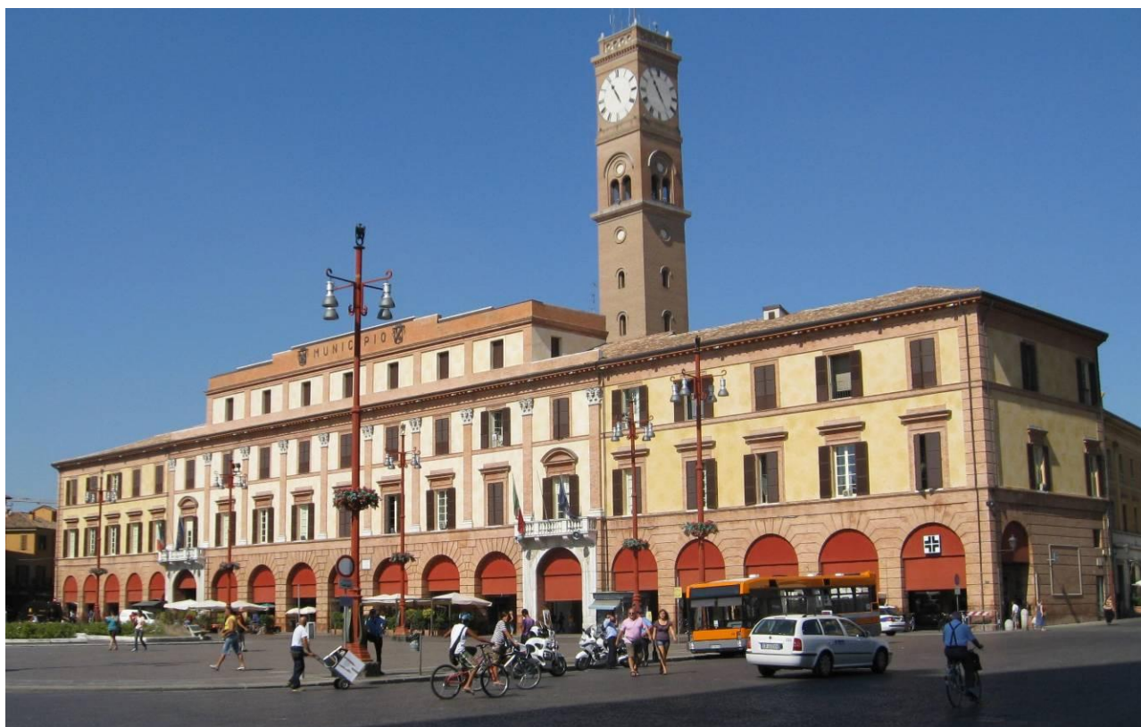
Palazzo del Comune di Forlì